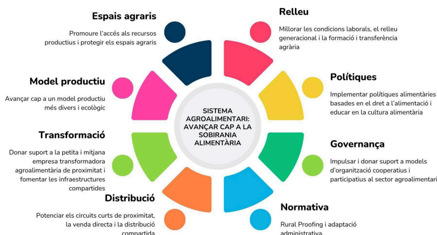
Figura 1. Subretos derivados del reto 4 de la Agenda Rural de Cataluña «Sistema Agroalimentario: avanzar hacia la Soberanía Alimentaria»