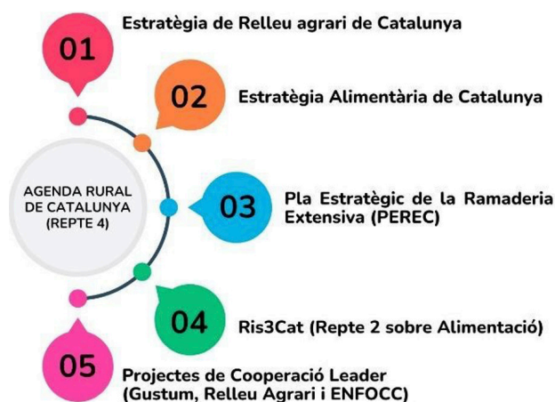
Figura 2. Paraguas estratégico vinculado al reto 4 de la Agenda Rural de Cataluña «Sistema Agroalimentario: avanzar hacia la Soberanía Alimentaria»

Buena parte de las acciones de la Agenda Rural vinculadas a este reto se organizan bajo un paraguas estratégico diverso que, partiendo de la misma Agenda, estructura, profundiza y refuerza las iniciativas desde diferentes escalas y ámbitos de actuación. Si bien esta interrelación estratégica es incipiente, apunta hacia nuevas formas de hacer y de cooperar que pueden conducir a transformaciones sistémicas importantes. Lo podemos consultar en la figura 2.